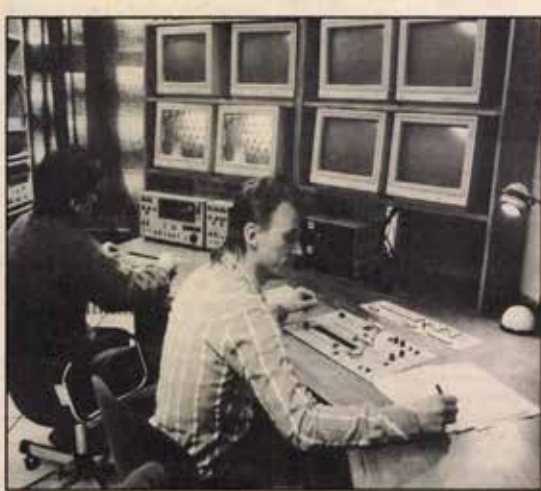
A stúdióban saját műsorok és zárt láncú tévéadások készülnek