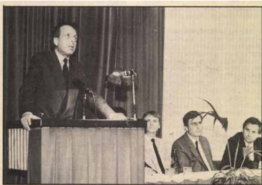
Kapolyi László kormánybiztos megköszönte a vállalat dolgozóinak áldozatos munkáját