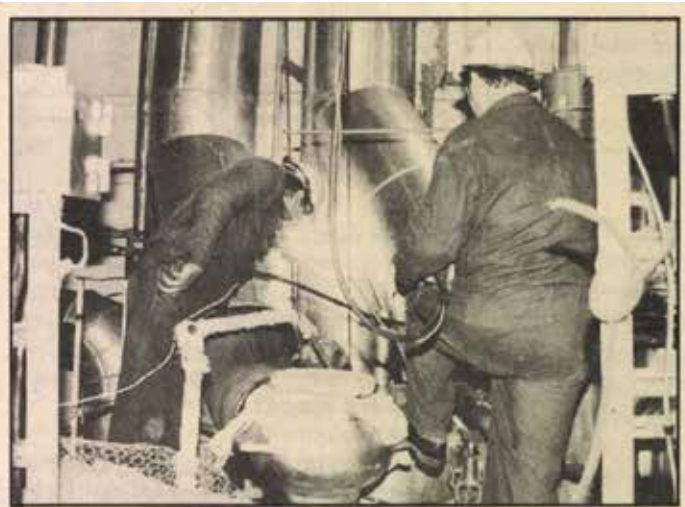
Hegesztők könyökcseré közben, a szekunder körben

Az atomerőmű idei fenntartási költségkerete meghaladja az egymilliárd forintot. Az összeg mintegy felét fordítják a négy blokk karbantartási munkálataira. Az 1. blokk április 29-én állt le, a karbantartók május 2-án láttak munkához az R-55-ös számítógéppel kidolgozott főjavítási hálóterv alapján, amit 23 nap alatt kell befejezni.