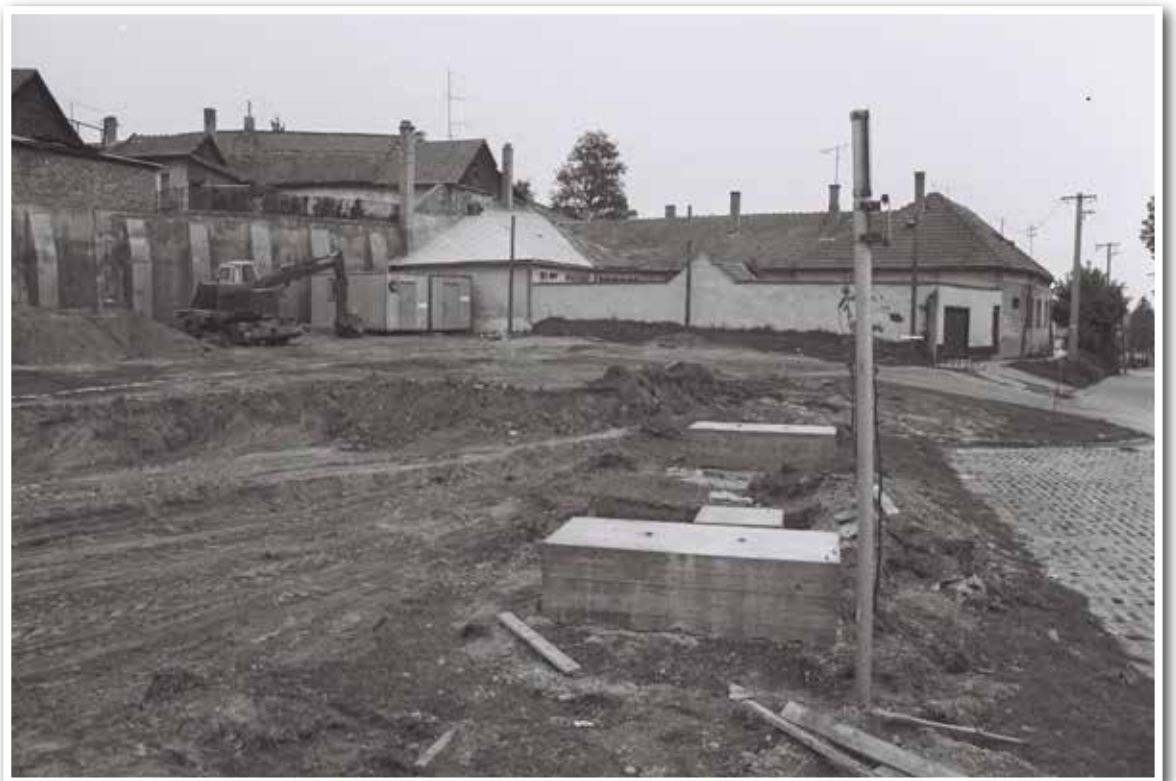
A török temető alsó része