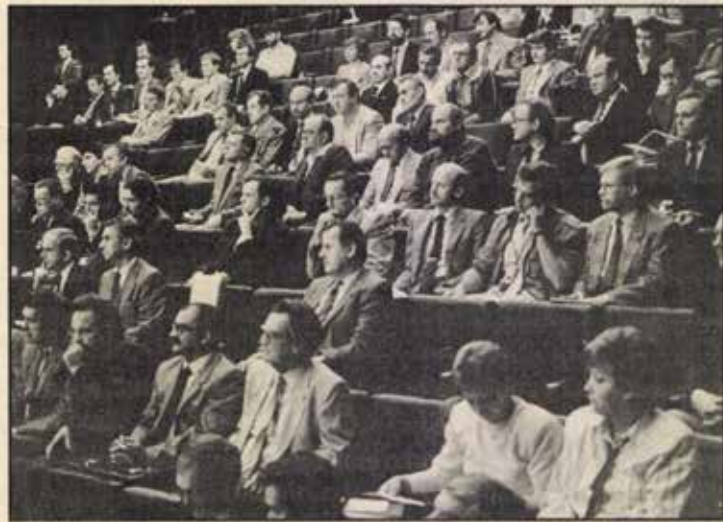
A résztvevő szakemberek egy csoportja

– 08. 25. 1–2. p.: Megkezdte munkáját a IV. atomenergetikai szimpózium c.