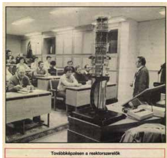
Továbbképzésen a reaktorszerelők

Az oktatóbázison eddig a PAV mintegy négyezer alkalmazottja szerezte vagy újíttotta meg szakképesí-