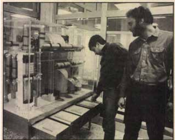
A gőzturbina és főbb segédrendszereknek modellje