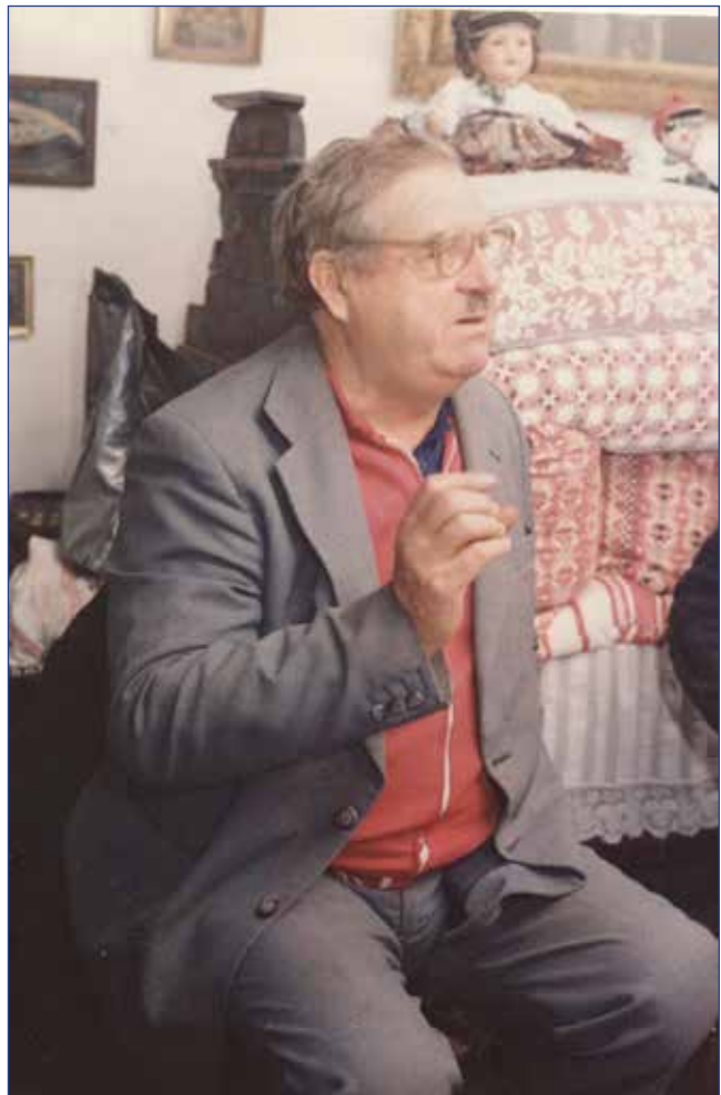
A régműltről mesélve