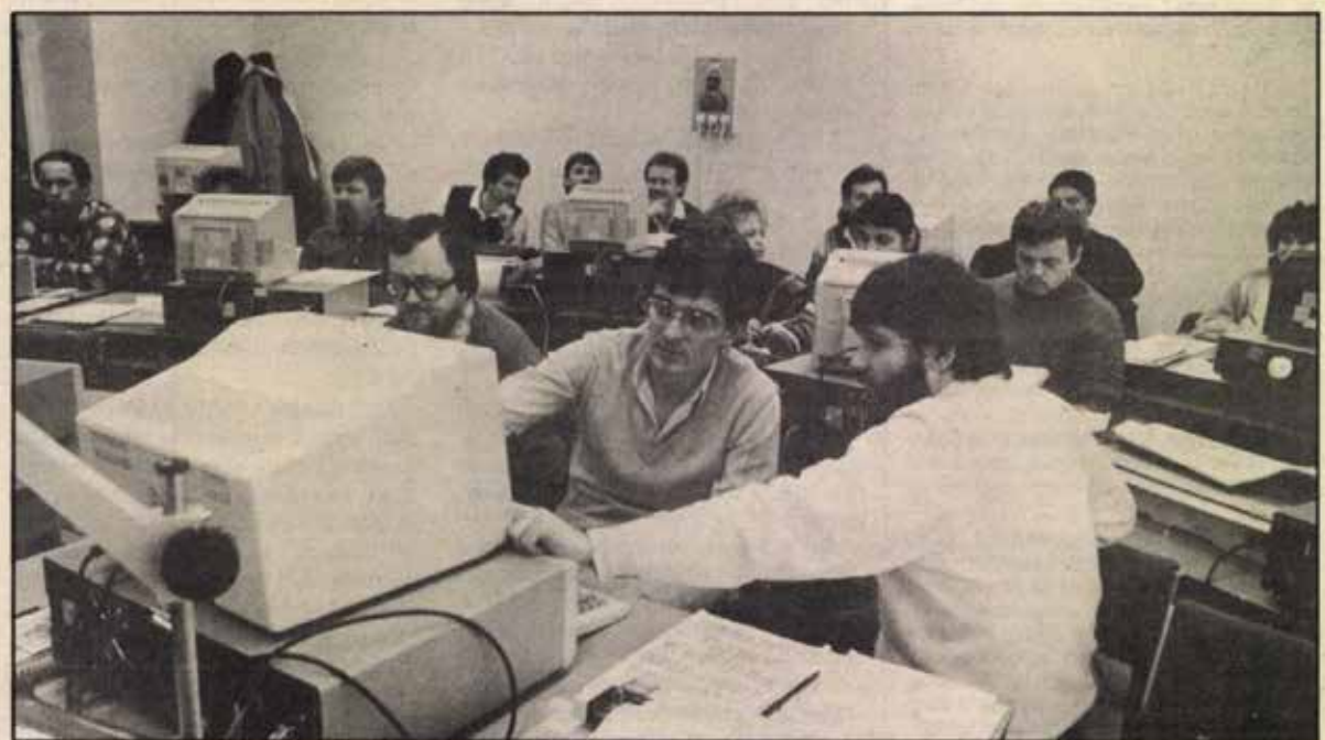
Az IBM PC-tanfolyamon a nagy karbantartások előkészítését végző szakemberek vesznek részt

tését, s a tervek szerint a jövőben cseh, kubai és német erőművekből is érkeznek „diákok”.