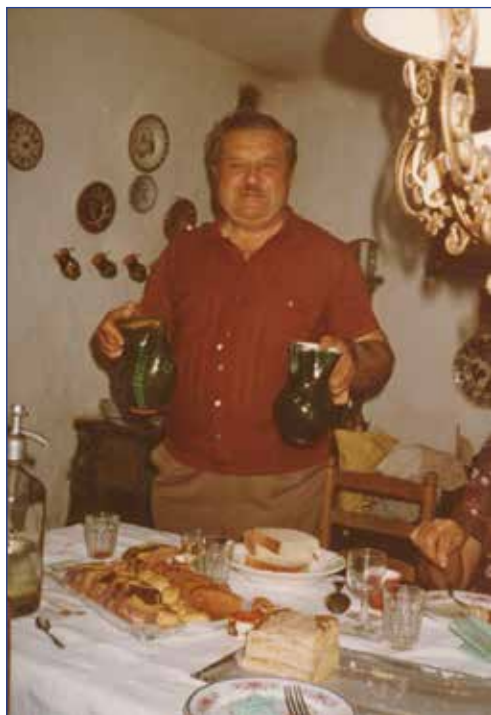
Vendégség a tanyán. 1980-as évek