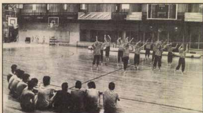
Az iskola táncosainak bemutatója

– 12. 03. 1. p.: Kiváló minősítést adott a bizottság c. Nemzetközi szakértői vizsgálat volt a paksi atomerőműben. A budapesti Palace Hotelben megtartott sajtótájékoztatón a Nemzetközi Atomenergia-ügynökség Üzemeltetési Biztonságot Felügyelő Csoportja (OSART) kiválóra értékelte az atomerőművet.