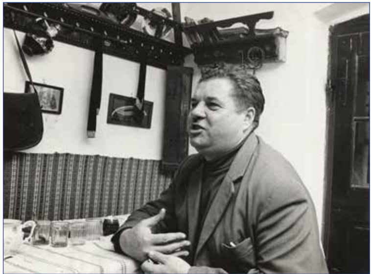
A tanya szobájában