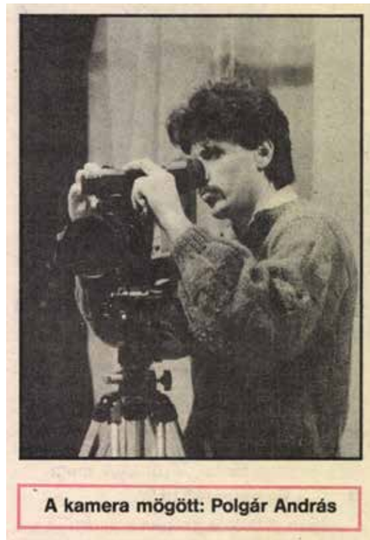
A kamera mögött: Polgár András