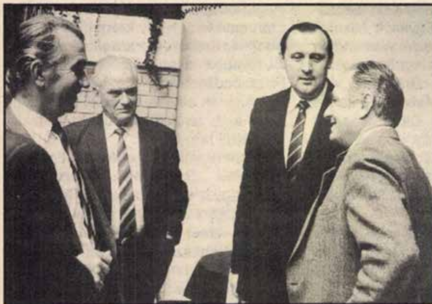
Az atomerőműben megyénk vezetőivel